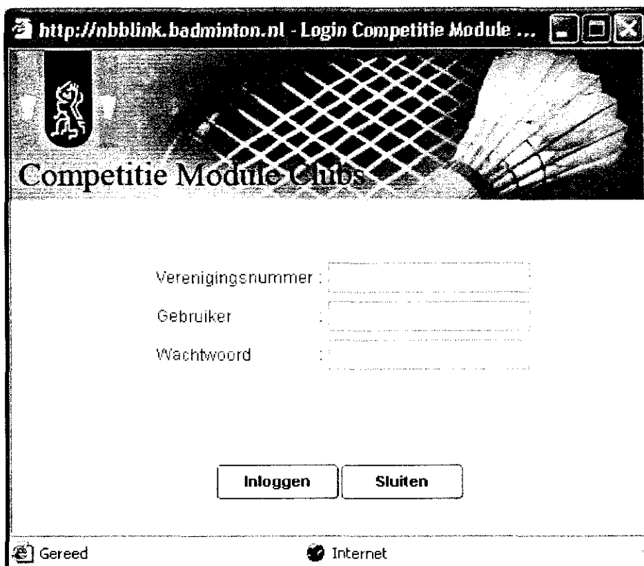
Figuur 1. Inlogvenster voor de competitie module

Via http://nbblink.badminton.nl/competitielauncher.htm verschijnt er het volgende plaatje op het beeldvenster. Het kan zijn dat door een Pop Up blokker dit scherm niet verschijnt u dient dan de Pop Up blokker uit te schakelen.